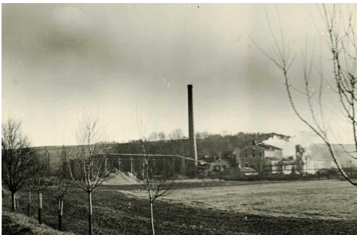
Cukrovar v roce 1962

V roce 1967 ukončil cukrovar svou činnost.